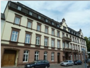
Hotel „Eifeler Hof“ mit Gartenanlage und Pavillons 54655 Kyllburg, Hochstr. 2 Öffnungszeiten: 12:00 Uhr bis 18:00 Uhr