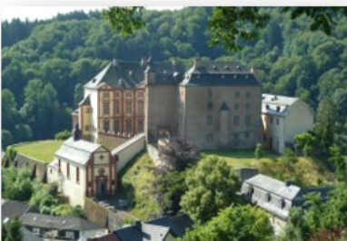
Schlossanlage mit historischen Gärten und Schlosskapelle 54655 Malberg, Schlossstr. 45 Öffnungszeiten Schloss Malberg : 10:00 Uhr bis 18:00 Uhr Öffnungszeiten Schlosskapelle : 14:00 Uhr bis 19:30 Uhr