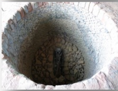
Kalköfen und Göpelwerk 54533 Gransdorf, Gelsdorfweg Öffnungszeiten: 11:00 Uhr bis 16:00 Uhr