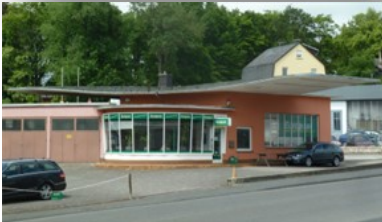
Tankstelle aus den 50-er Jahren, 54634 Bitburg, Saarstr. 20 Öffnungszeiten: 13:00 Uhr bis 18:00 Uhr