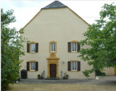
Pfarrhaus und Pfarrgarten 54636 Dockendorf, Hauptstr. 12 Öffnungszeiten: 10:00 Uhr bis 18:00 Uhr

Zeitgemäßes Bauen im Eifelkreis Bitburg-Prüm. Eine Aktion des Eifelkreises und der Architektenkammer Rheinland-Pfalz. www.eifel-baukultur.de