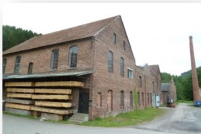
Historische Rohrzieherei 54655 Usch, Kyllburger Str. 1