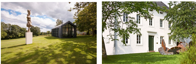
Foto oben: Lager- und Ausstellungsgebäude (2008), Architektin Anja Axt, Trier ( www.axtarchitekten.com/ )

Fotos 2.Reihe : Gestaltung Innenräume mit Kunstwerken