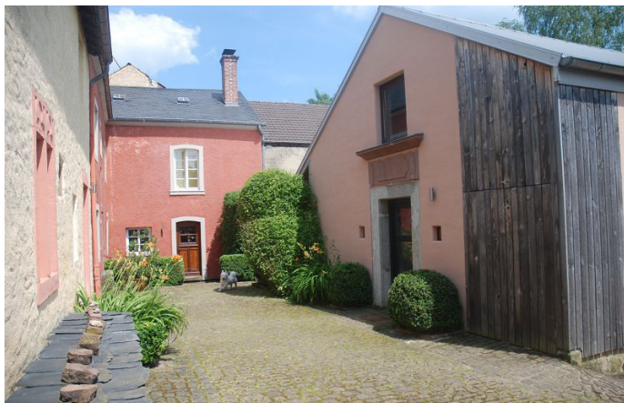
Foto oben: die Straßenansicht mit Vorgarten | Foto Mitte: Der Eingang zum Wohnhaus über den Hof | Foto unten: Das Anwesen aus Blickwinkel des Innenhof mit der Werkstatt rechts im Bild | Bild rechts: ein Teil der mühevoll freigelegten Wandmalereien.

Bauherr/ Fotos: Esther und Hardy Diedrich, Bickendorf