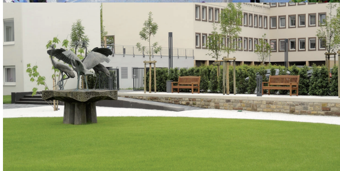
Skulpturengarten Haus Beda, Bitburg (2012)

Landschaftsarchitekten/ Entwurfsplan/ Animation: